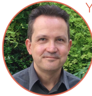
Yannick Dehée Nouveau monde éditions

yanndehee@nouveau-monde.net 44, Quai Henri-IV 75004 Paris - France t. +33 (0)143546743 | www.nouveau-monde.net